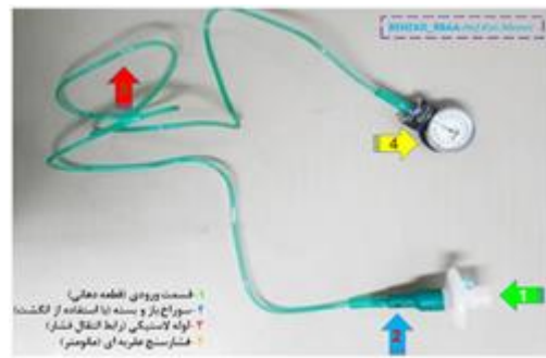
شکل ۲. ابزار مورد استفاده جهت انجام مانور والسالوا

در ادامه به بررسی میانگین پارامترهای همودینامیک شامل فشار خون سیستولیک، فشار خون دیاستولیک و فشار خون متوسط شریانی، ضربان قلب و سطح اکسیژن خون پرداخته شده است. در جدول ۳ این مقادیر میانگین در طول مدت زمان مطالعه یعنی از قبل از شروع مداخله تا ده دقیقه بعد از شروع مداخله مورد مقایسه قرار گرفته است. سه گروه مورد مطالعه از