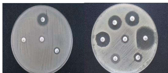
شکل ۱. انواع مختلف سویه های MLBs/استافیلوکوکوس اورئوس

نتایج مقاومت بر اساس تست‌های فنوتیپی: از مجموع ۱۱۳ ایزوله استافیلوکوکوس اورئوس به دست آمده از نمونه‌های مختلف ۱۳ ایزوله (۱۱/۵٪) دارای فنوتیپی D بودند. بر اساس مقاومت به کلیندامایسین-اریترومایسین، ۶۹ ایزوله (۶۱/۰۶٪) دارای فنوتیپی S بودند. علاوه بر این ۱۱ ایزوله (۹/۷٪) دارای فنوتیپی R بودند. ایزوله‌های به دست آمده از نمونه‌های کشت ادرار و کشت خون دارای بیش‌ترین فراوانی بودند، به طوری که از ۱۳ ایزوله دارای فنوتیپی D، ۵ ایزوله از کشت ادرار و ۴ ایزوله از کشت خون جداسازی گردید. هم‌چنین از ۱۱ ایزوله دارای فنوتیپی R، ۶ ایزوله از کشت ادرار و ۳ ایزوله از کشت خون به دست آمد (شکل ۱).