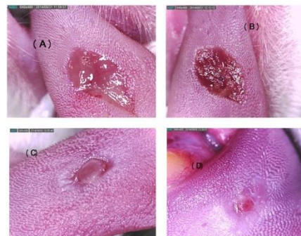
شکل ۲. عکس از روند بهبود زخم ایجاد شده بر روی زبان رت: (A) روز اول، (B) روز سوم، (C) روز ششم، (D) روز دهم