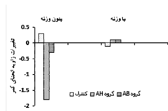
شکل ۲. مقایسه میزان تغییرات زاویه انحنا کمر (برحسب درجه) در بین سه گروه (Abdominal Hollowing (AH), Abdominal Bracing (AB) و گروه کنترل. علامت منفی: نشانه تحذب انحنای

اثر تمرینیک جلسه ای بر روی انحنای کمر. بین زاویه انحنای کمر سه گروه تفاوت معنی داری وجود نداشت بنابراین سه گروه در شروع مطالعه مشابه بودند. آنالیز ANOVA نشان داد که بین دو گروه مداخله و کنترل تفاوت معنی داری در انحنای کمر در وضعیت با و بدون لود محوری دیده نشد ( P > 0.05 ). مقایسه دو گروه مداخله تمرینی نشان داد فقط در گروه AH در هر دو وضعیت با و بدون لود محوری تغییرات معنی دار دیده شد. بعد از تمرین در وضعیت بدون لود محوری یک افزایش معنی دار در لوردوز کمر دیده شد (حدود ۲ درجه، P < 0.002 ) که با اعمال لود محوری کاهش معنی داریافت ( P < 0.05 ). اما تمرین AB نتوانست تغییر معنی داری در انحنای کمر ایجاد کند (شکل ۲).